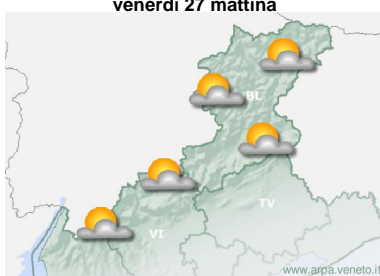
venerdì 27 mattina