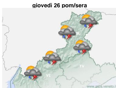
giovedì 26 pom/sera