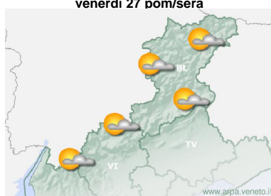
venerdì 27 pom/sera