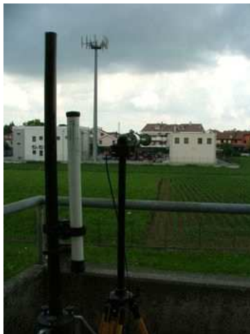
Foto del punto di misura