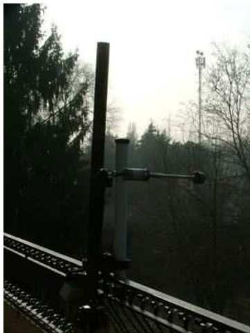
Foto del punto di misura