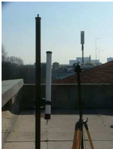
Foto del punto di misura