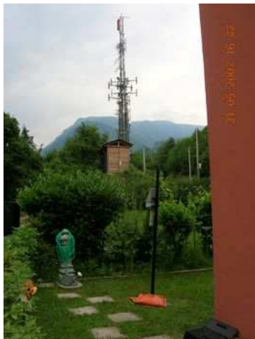
Foto del punto di misura