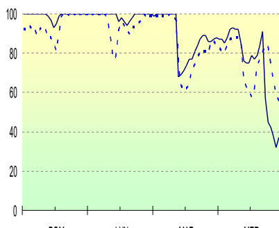
Umidità rel. aria 2m (%) ultimi 4 g.