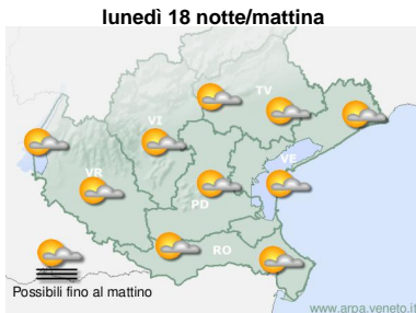
lunedì 18 notte/mattina