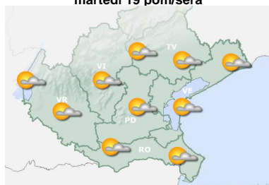
martedì 19 pom/sera