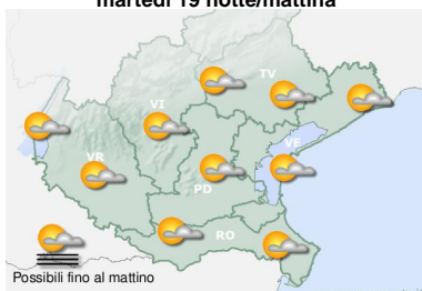
martedì 19 notte/mattina