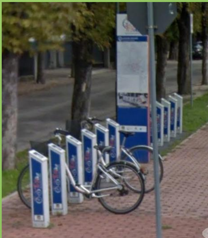
Bici a noleggio