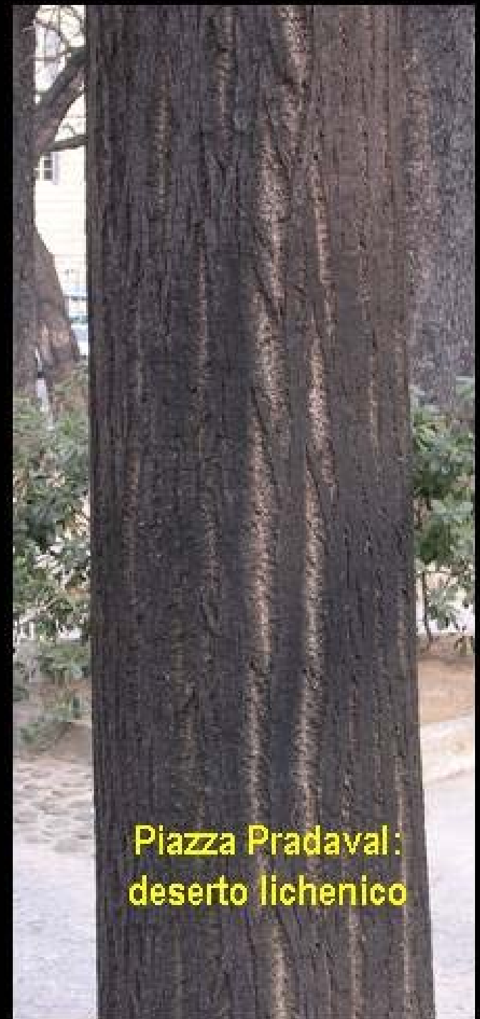
Piazza Pradaval: deserto lichenico