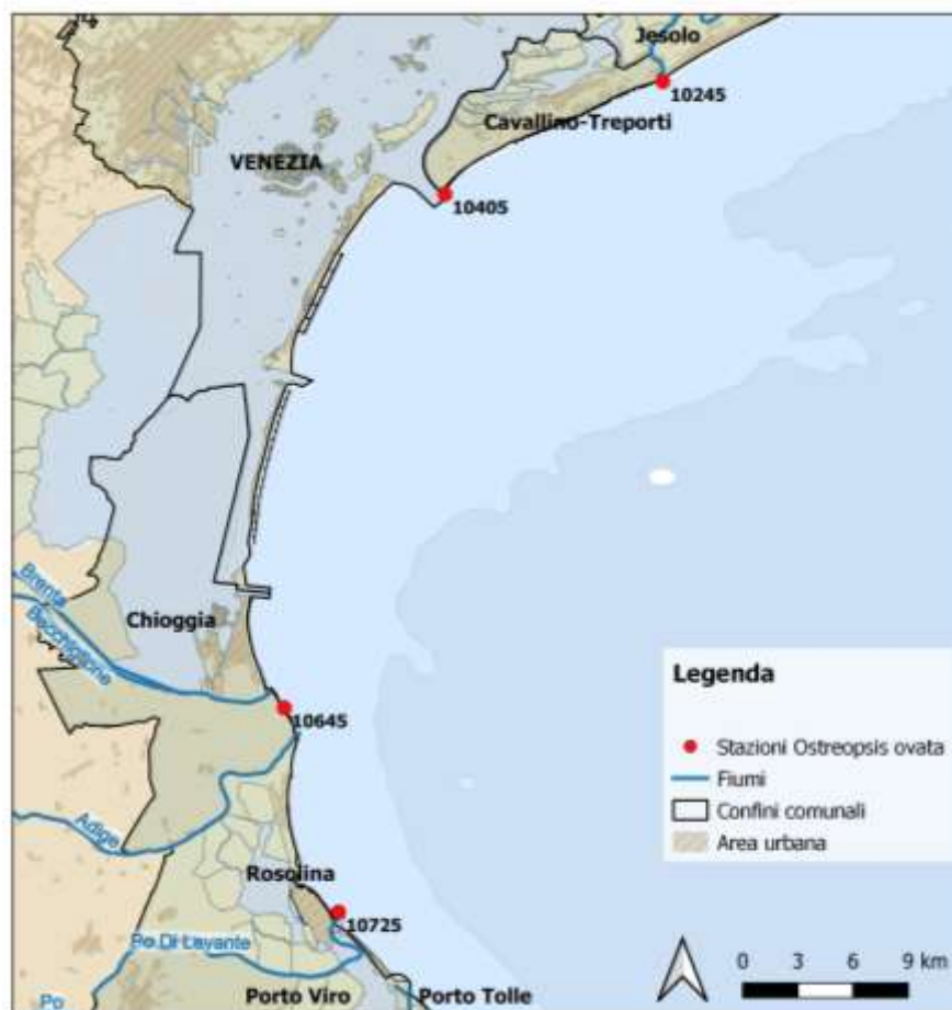
Figura 1: Localizzazione delle stazioni di campionamento