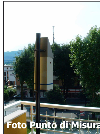
Foto Punto di Misura