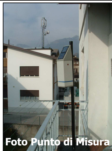
Foto Punto di Misura