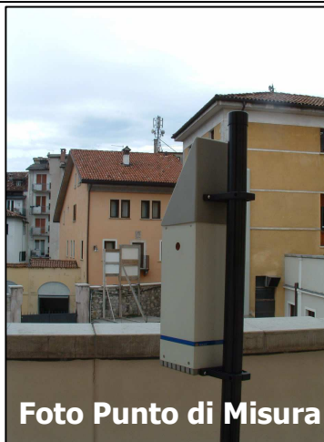
Foto Punto di Misura