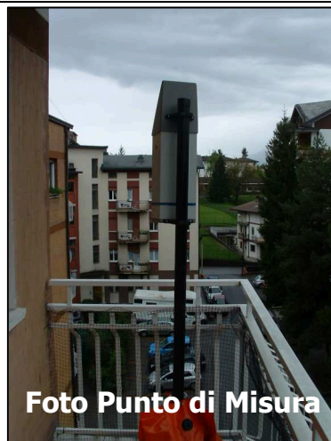
Foto Punto di Misura