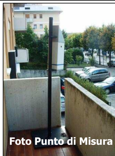
Foto Punto di Misura