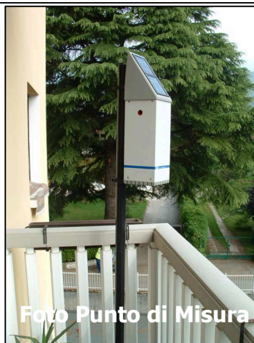
Foto Punto di Misura