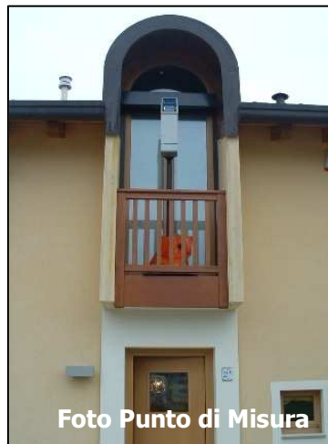
Foto Punto di Misura