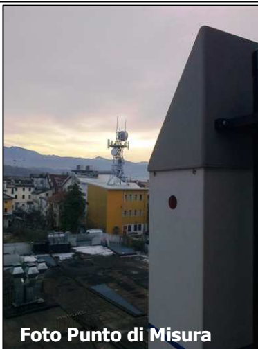
Foto Punto di Misura