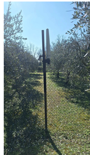
Uliveto Via Cero di Mezzo 2a, Calaone Baone (PD)