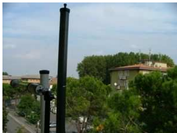
Foto del punto di misura