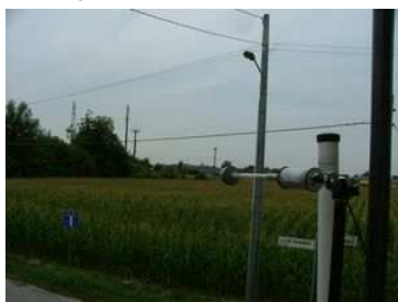
Foto del punto di misura