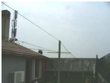
Foto del punto di misura