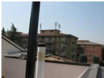
Foto del punto di misura