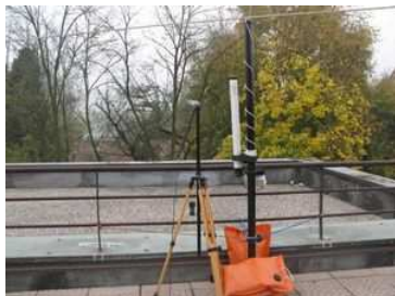
Foto del punto di misura