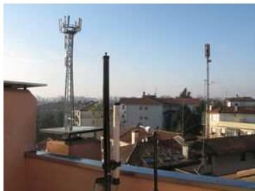
Foto del punto di misura