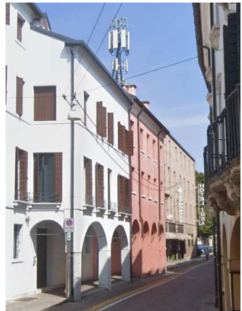
via Ospedale Civile 24, Padova