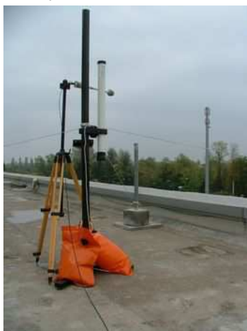
Foto del punto di misura