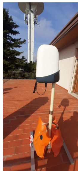
Misure di campo elettrico (V/m) Via Zanini n.23 - Rosolina (RO)