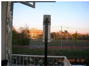
Foto del punto di misura