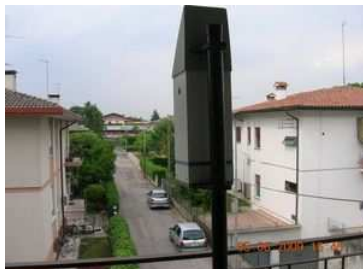
Foto del punto di misura