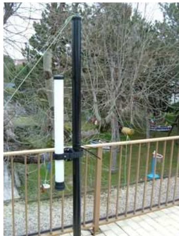
Foto del punto di misura