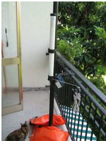
Foto del punto di misura

Agenzia Regionale per la Prevenzione e Protezione Ambientale del Veneto