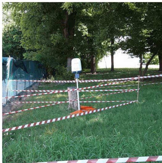
Misure di campo elettrico (V/m) Scuola Giotto Dolo