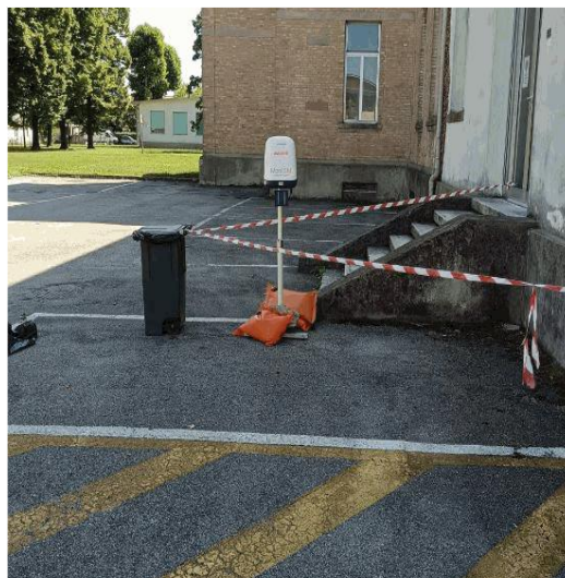
Misure di campo elettrico (V/m) Scuola De Amicis Dolo