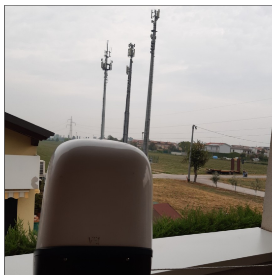
Misure di campo elettrico (V/m) via Milano 49F - Fiesso d'Artico