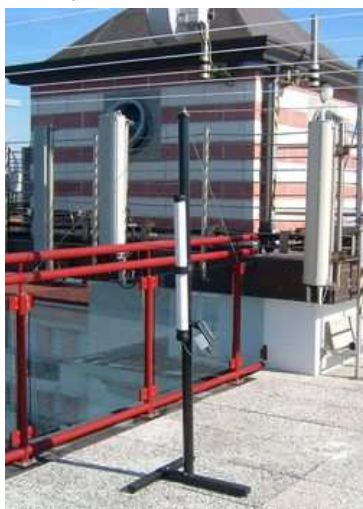
Foto del punto di misura