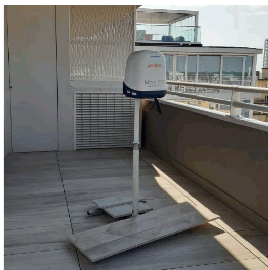
Misure di campo elettrico (V/m) via Dante Alighieri, 44A Jesolo