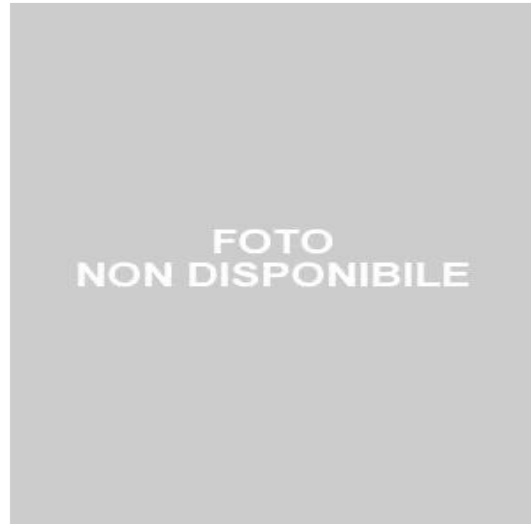
Misure di campo elettrico (V/m) Municipio Jesolo