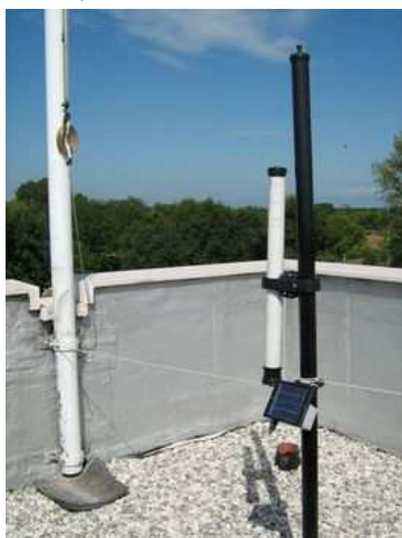
Foto del punto di misura