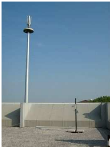
Foto del punto di misura