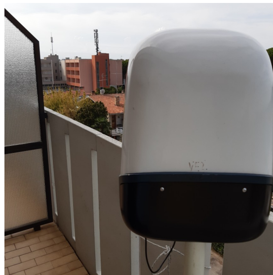
Misure di campo elettrico (V/m) via della Vega 11, Bibione - San Michele al Tagliamento