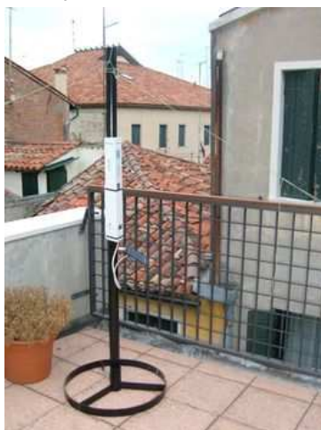
Foto del punto di misura

Agenzia Regionale per la Prevenzione e Protezione Ambientale del Veneto