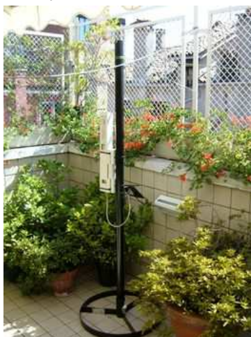
Foto del punto di misura

Agenzia Regionale per la Prevenzione e Protezione Ambientale del Veneto