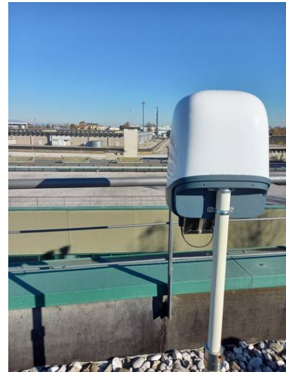
via Zamenhof 353, Vicenza