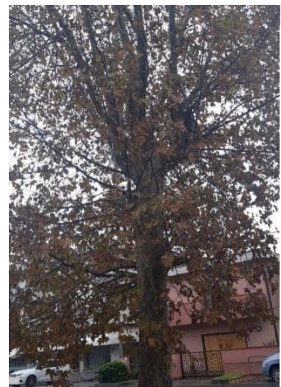
Rovigo, Viale della Pace: il platano in veste estiva ed autunnale