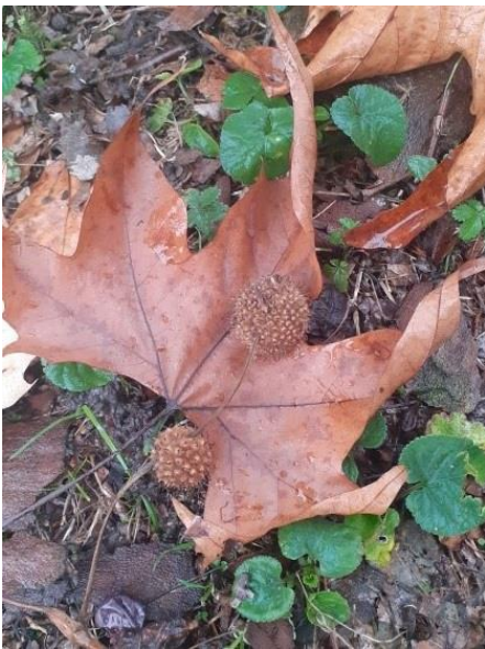
Foglie e frutti del platano

26 novembre 2021. L'autunno, una stagione dai colori caldi di tonalità rosse, gialle, marroni e arancio. A prima vista questa sembra la descrizione del bosco montano, ma passeggiando per parchi e giardini di una città, anche in pianura, si ritrovano gli stessi colori. Un protagonista di questa armonia di colori è il platano (famiglia delle Platanaceae), albero monumentale, che può raggiungere i 20-30 metri di altezza. I fiori piccoli e non profumati non attirano gli insetti ma per la dispersione dei microscopici granuli di polline interviene il vento. I frutti hanno il curioso nome di achenio, con numerosi peli che ne aiutano la dispersione aerea.