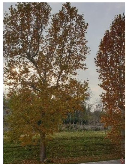
Strada verso Carceri D'Este