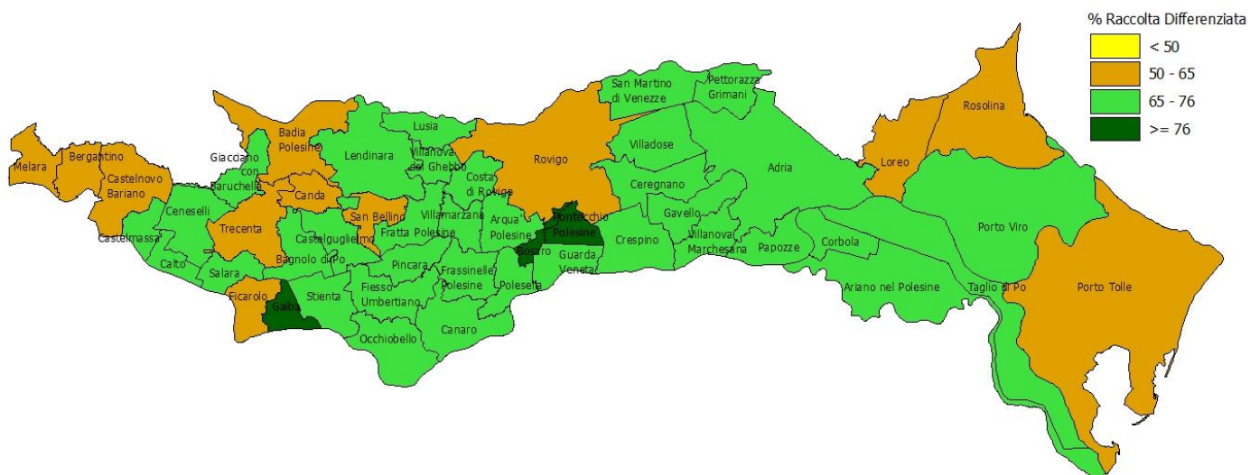
Distribuzione dei comuni in base agli obiettivi di raccolta differenziata raggiunti - Anno 2014 - Fonte: ARPAV - Osservatorio Regionale Rifiuti.